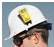
Clip für Schutzhelm