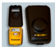
Gehäuse für Ruhezustand